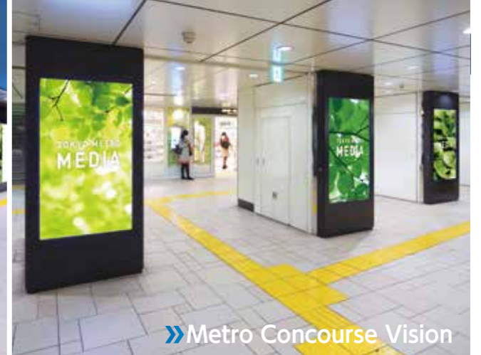
Metro Concourse Vision