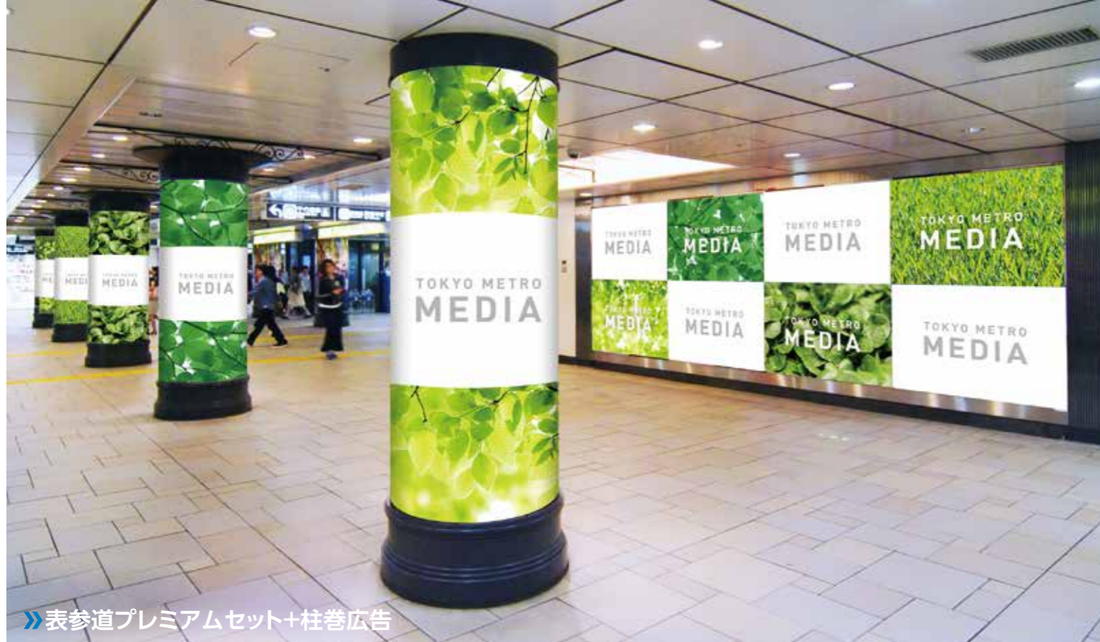
表参道プレミアムセット+柱巻広告