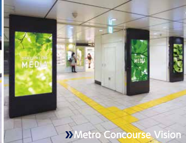
Metro Concourse Vision