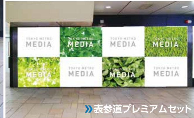
表参道プレミアムセット