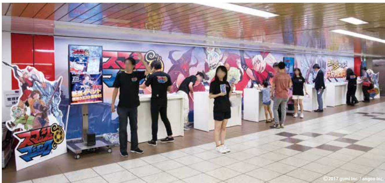
© 2017 gumi Inc. / angoo Inc.

東京メトロの各駅に設置されたイベントスペースや展示スペースで、新商品の発表などができます。商品サンプルなどに直接触れることができたり、双方向のコミュニケーションが実現できたり、多くの人々が行き交う駅構内で直接的なプロモーションができます。