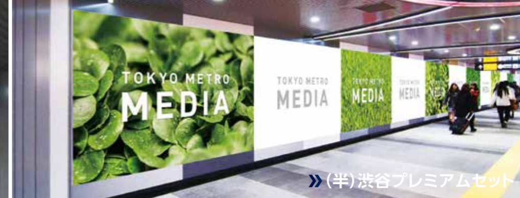
» (半)渋谷プレミアムセット