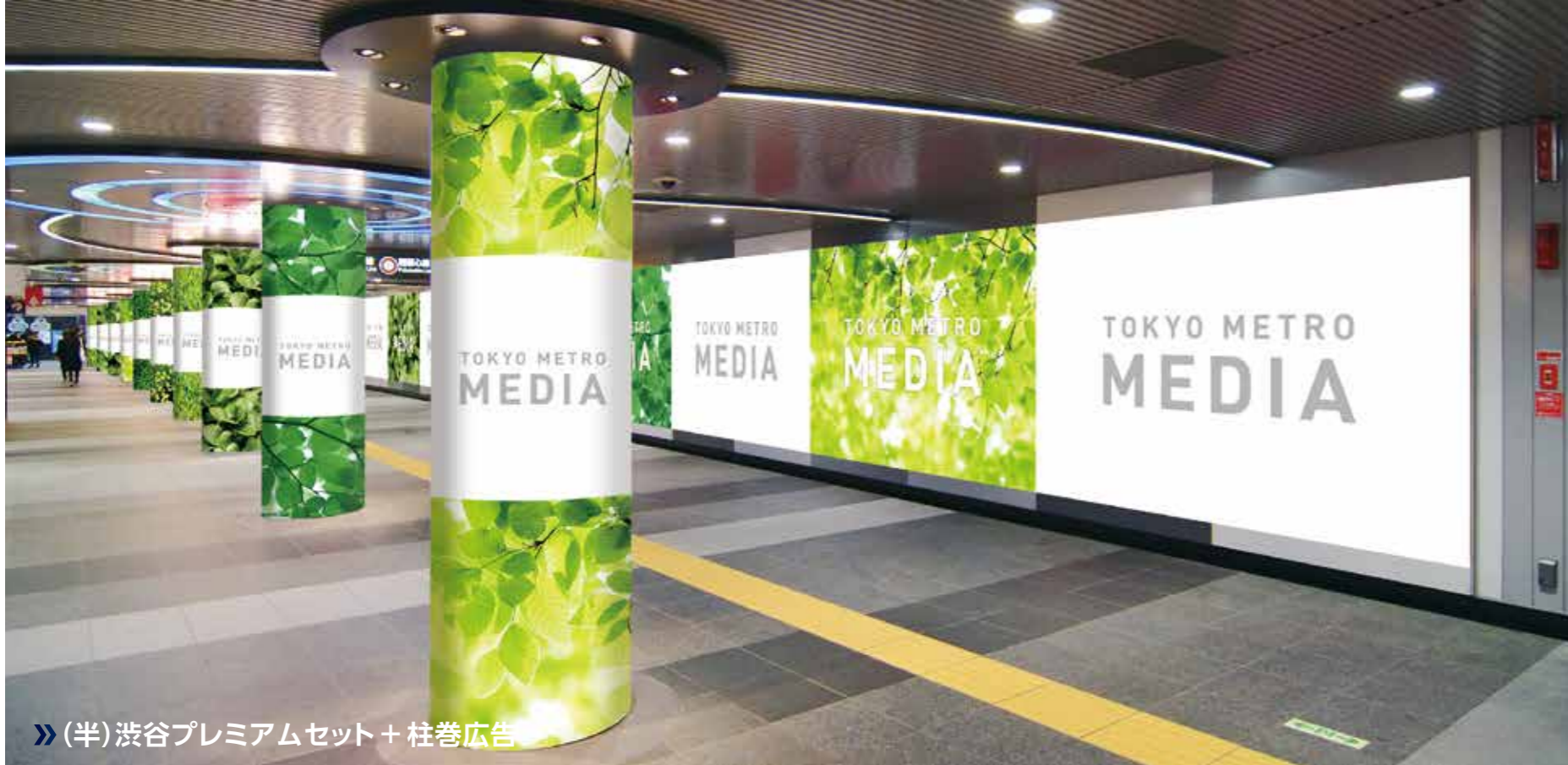
» (半)渋谷プレミアムセット + 柱巻広告