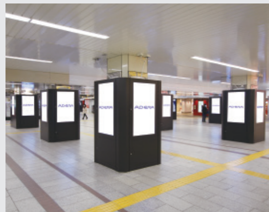
御堂筋線 なんば駅 なんばウォーク前