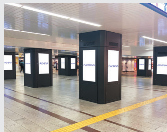
御堂筋線 なんば駅 なんばウォーク前