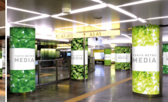
臨時柱巻(銀座四丁目エリア)