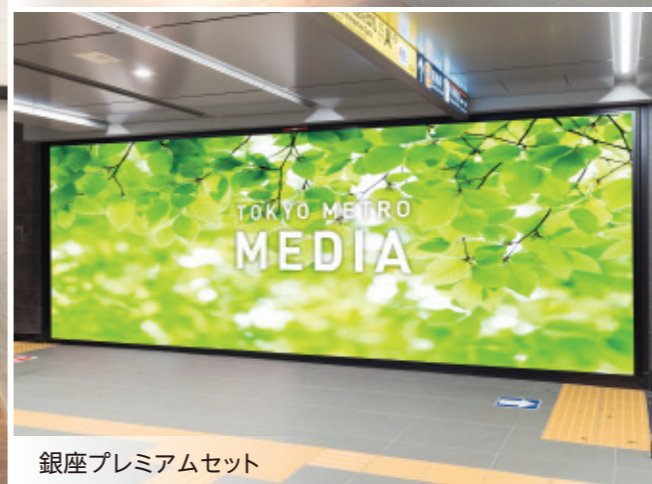
銀座プレミアムセット