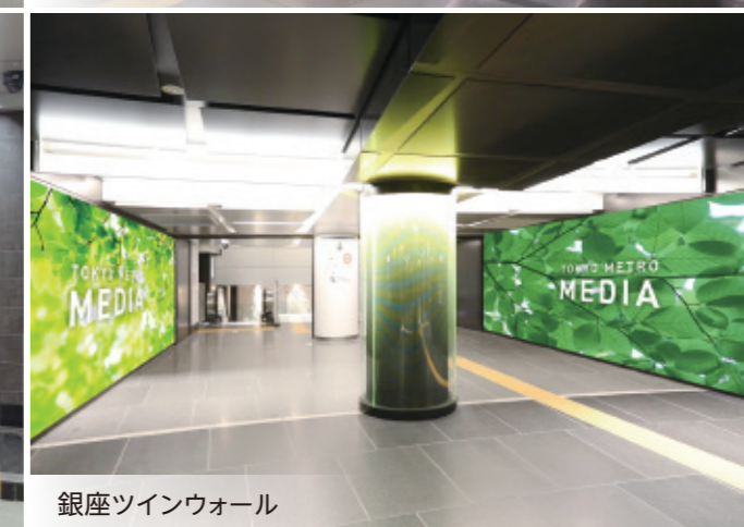
銀座ツインウォール