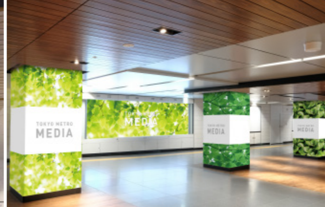
銀座ノーブルビジョン+臨時柱巻(ノーブルビジョンエリア)