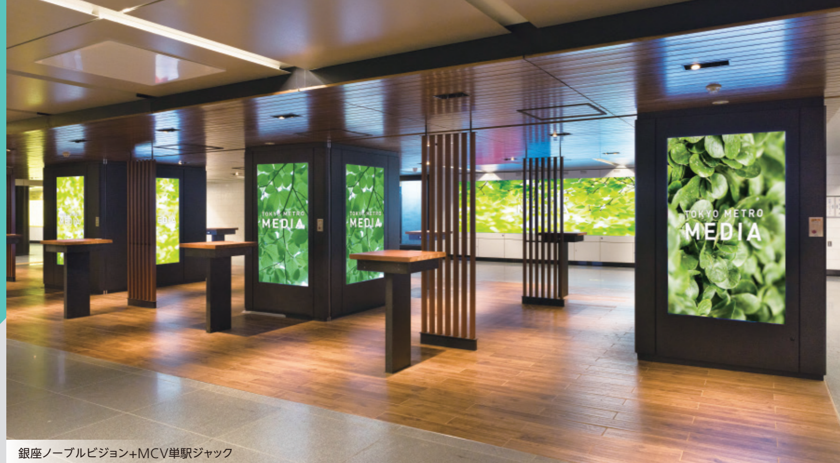
銀座ノーブルビジョン+MCV単駅ジャック