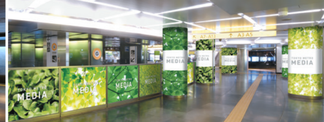
臨時柱巻+ガラス臨時シート(銀座四丁目エリア)