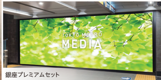
銀座プレミアムセット