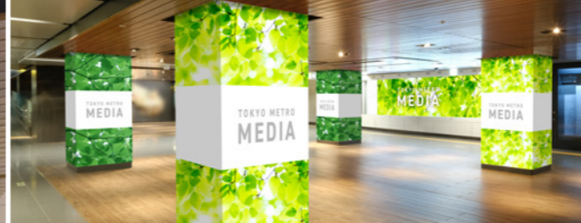
銀座ノーブルビジョン+臨時柱巻(ノーブルビジョンエリア)