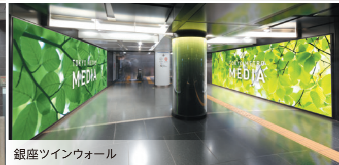
銀座ツインウォール