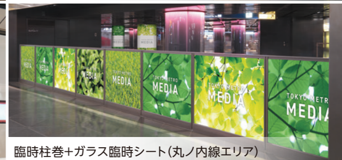
臨時柱巻+ガラス臨時シート(丸ノ内線エリア)